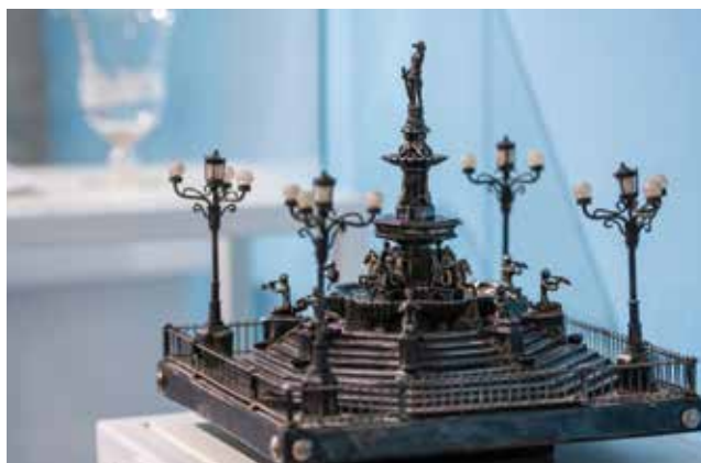
Detalji izložbenog postava