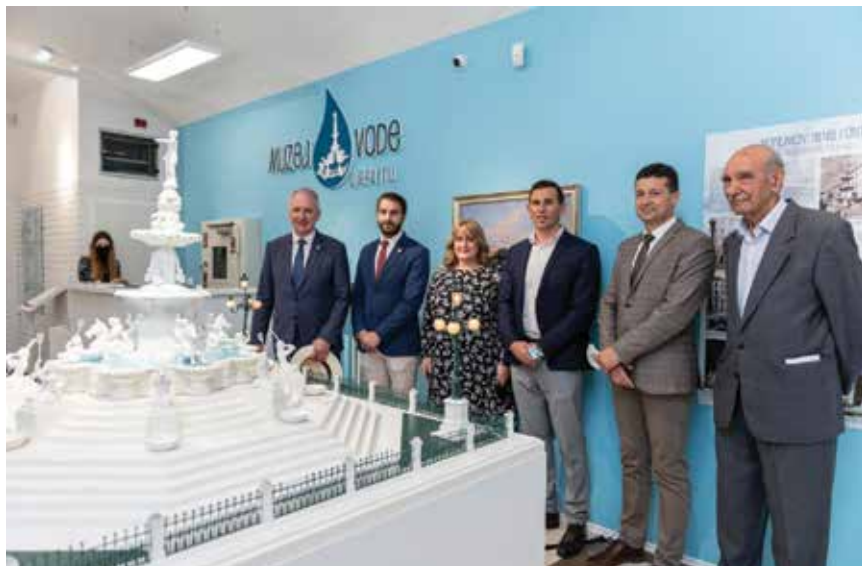
Detalj snimljen tijekom svečanog otvaranja izložbe

nom, na Trgu hrvatske bratske zajednice otvorena je nova Koncertna dvorana Ive Tijardovića, obnovljena je zgrada Stare