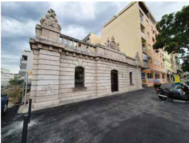
Zgrada vodospreme u Splitu izgrađena je u sklopu Dioklecijanova vodovoda

Tom je prigodom istaknuo to kako se u sklopu niza projekata splitsko-solinske aglomeracije zahuktavaju radovi vrijedni milijardu i 800 milijuna kuna kojima će se istočni dijelovi grada Splita spojiti na vodovod. Aktualan je i 140 milijuna kuna vrijedan projekt izgradnje pročistača vode na izvoru Jadrta, zahvaljujući kojemu građani Splita više neće piti zamućenu vodu. U toj povijesnoj zgradi vodovoda sagrađenoj davne 1879. paralelno s Monumentalnom fontanom novim generacijama i mladim sugrađanima treba približiti baštinu, povijest i važnost te žive, pitke vode u Splitu. Taj novi muzej bit će važan spomenik povijesnome razdoblju čije blagodati i danas uživa gotovo cijeli Split, istaknuo je u Krstulović Opara, zahvalivši pritom svima koji su nesebično doprinijeli provedbi toga projekta. Kako je rekao, taj novi muzej lijep je primjer suradnje Grada Splita, Vodovoda i kanalizacije te Muzeja grada Splita. Također je podsjetio na to kako su u proteklome razdoblju uložena velika sredstva u splitsku kulturnu infrastrukturu: obnovljen je Hrvatski dom s vrhunskom koncertnom dvora-