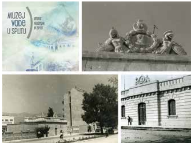
Nekadašnja zgrada vodospreme pretvorena je u moderan muzej posvećen vodi